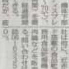
ミスト噴霧装置発売

イチゴ苗を均一灌水 灌水装置で均一に水を供給 灌水装置は、イチゴ苗に均一に水を供給する。灌水装置により、水が均等に分布し、苗の成長を促進する。価格は、1台約10万円。問い合わせ先は、株式会社（〒100-0001 東京都千代田区千代田1-1-1）。