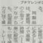
ミスト噴霧装置発売

イチゴ苗を均一灌水 灌水装置で均一に水を供給 灌水装置は、イチゴ苗に均一に水を供給する。灌水装置により、水が均等に分布し、苗の成長を促進する。価格は、1台約10万円。問い合わせ先は、株式会社（〒100-0001 東京都千代田区千代田1-1-1）。