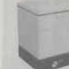
ミスト噴霧装置発売

鳥獣撃退器を発売 ワイヤレスで簡単設置で導入し易く ワイヤレスで簡単設置できる鳥獣撃退器を発売。鳥獣の侵入を感知すると、超音波や光で鳥獣を撃退する。設置が簡単で、導入しやすい。価格は、1台約10万円。問い合わせ先は、株式会社（〒100-0001 東京都千代田区千代田1-1-1）。