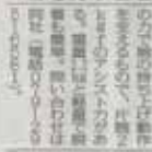
家庭用食品乾燥機

遠隔制御装置を開発 ビニールハウスの巻上・灌水 遠隔制御装置は、スマートフォンからビニールハウスの巻上・灌水を制御できる。これにより、作業の手間を削減し、効率を向上させることができる。価格は、1台約10万円。問い合わせ先は、株式会社（〒100-0001 東京都千代田区千代田1-1-1）。