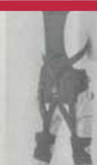
ワーキングパワーーツ

西村製作 気体溶解装置を出展 高酸素水で植物を活性化 西村製作は、気体溶解装置「高酸ファイター」を出展する。この装置は、空気中の酸素を水に溶解させ、植物の根元に供給する。これにより、植物の成長を促進し、病害を予防することができる。また、高酸素水は、土壌のpHを調整し、養分の吸収を助ける効果もある。価格は、1台約10万円。問い合わせ先は、西村製作（〒100-0001 東京都千代田区千代田1-1-1）。