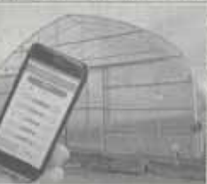
遠隔制御装置を開発

パネの力で負担軽減 アツリ無動力アシストスーツ アツリ無動力アシストスーツは、作業時の負担を軽減するためのウェア。背中にパネを装着し、作業時にパネの力で作業を補助する。これにより、腰痛や肩痛などの労務災害を予防することができる。価格は、1着約5万円。問い合わせ先は、アツリ（〒100-0001 東京都千代田区千代田1-1-1）。